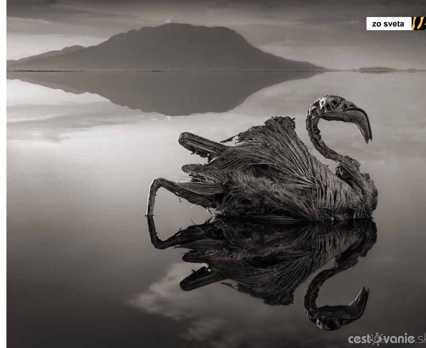
Brandt sa nechl inšpirovať mŕtvymi zvieratami.

Brandt, ktorý strávil veľa času v Afrike ako fotograf a ochranca prírody, si všimol drsný, ale fascinujúci výjav v podobe