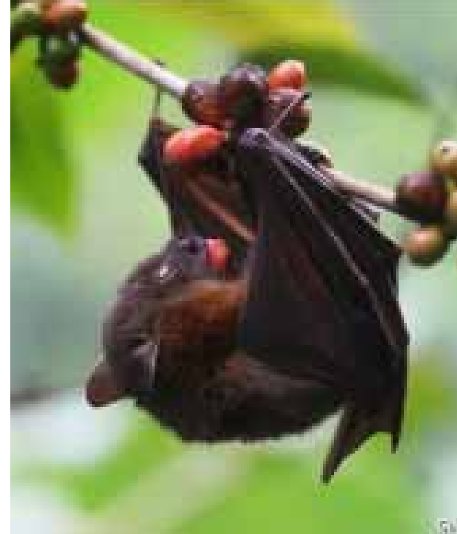
Opäť nájdený vyhinutý netopier.