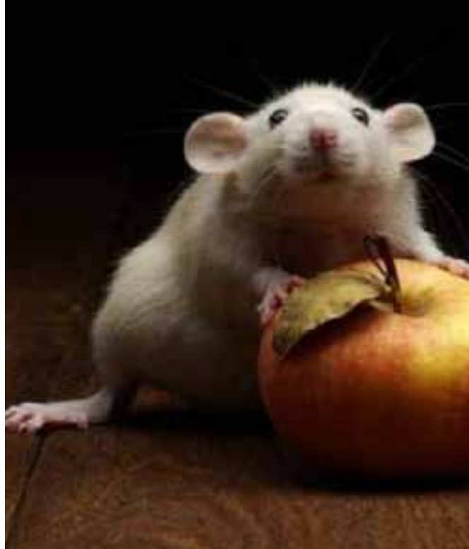
Potkany sú chitrejší ako ľudia, dokázal to nezávislý test.